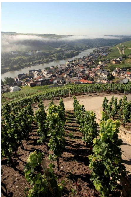
Angsar Schmitz / Moselwein e.V