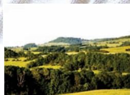
POUR NOTRE TERRITOIRE