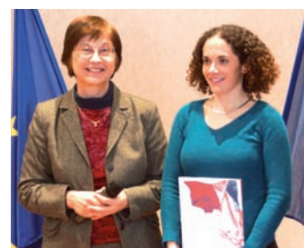
Cérémonie d'accueil des nouveaux français

Nous ne pouvons pas écrire "le grand récit républicain" ni le "dessein européen" sans les citoyens. "La démocratie est d'abord un état d'esprit" (Pierre Mendès France).