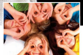
UNE NOUVELLE CITOYENNETÉ