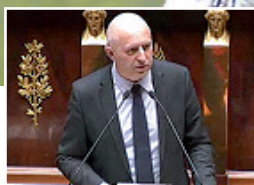
A L'ASSEMBLÉE NATIONALE